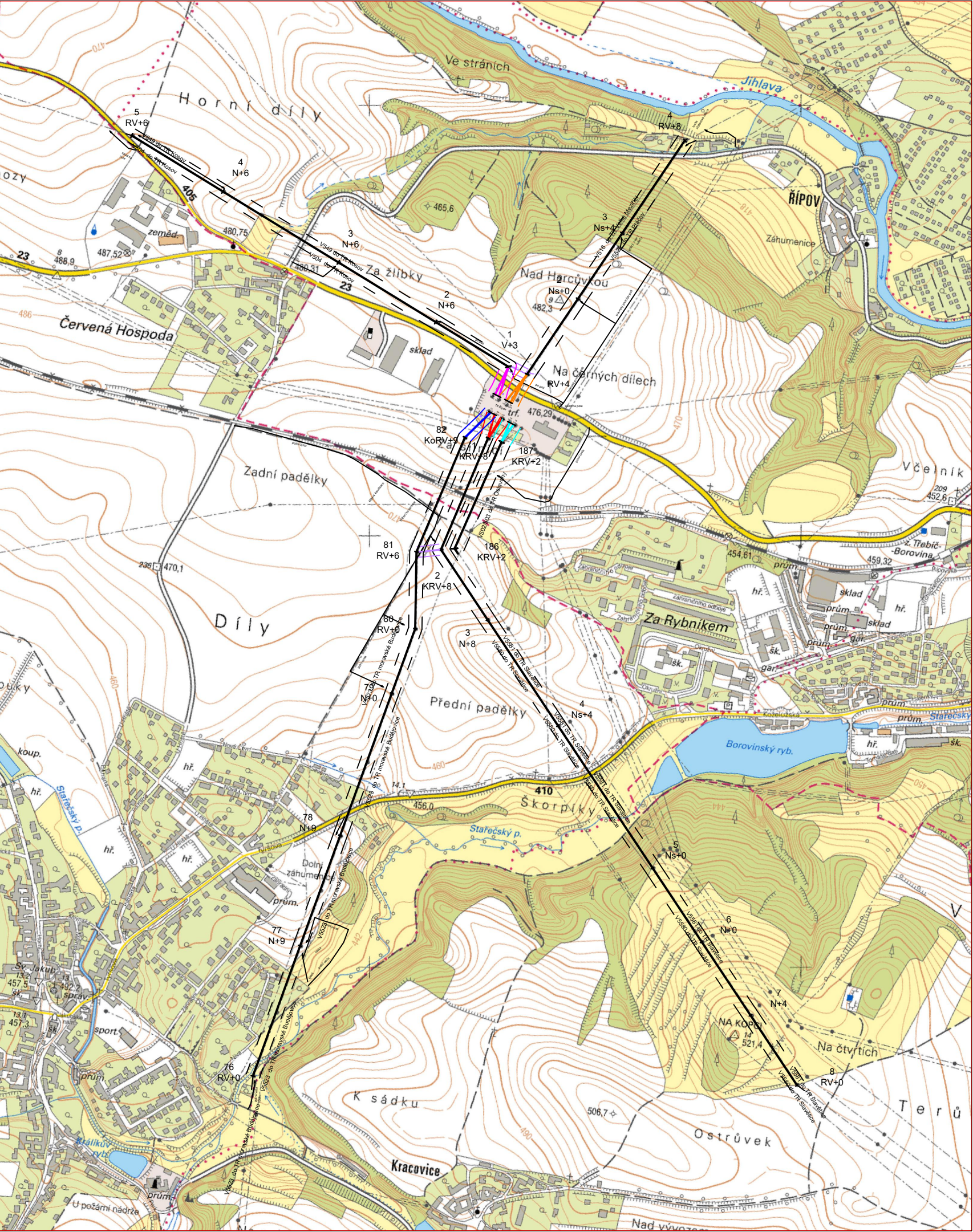
Detail zaústění do TR Řípov